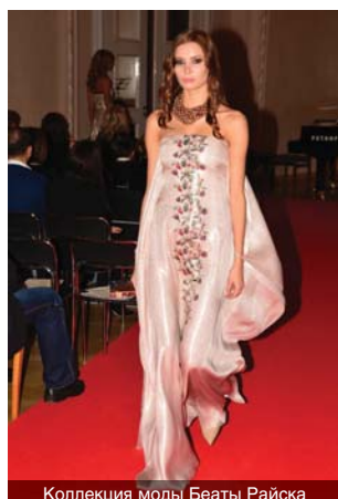
Коллекция моды Беаты Райска