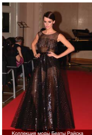
Коллекция моды Беаты Райска