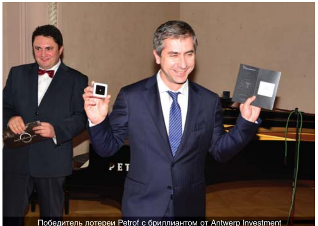
Победитель лотереи Petrof с бриллиантом от Antwerp Investment

Хотя войны и революции заставляли останавливать процесс производства на некое время, семья тщатель-