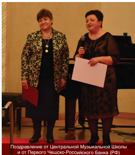
Поздравление от Центральной Музыкальной Школы и от Первого Чешско-Российского Банка (РФ)

тием технологий и новых материалов и используем их в производстве. Наши инструменты должны быть безупречно качественными.»