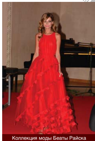
Коллекция моды Беаты Райска